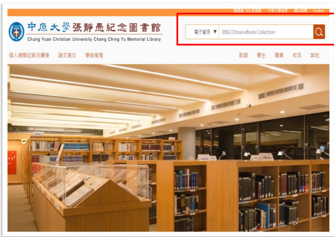
圖書館首頁，以「電子資源」搜尋「Ebscohost eBook Collection」